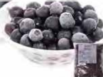
IQFフルーツ ブルーベリー