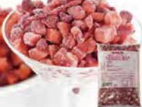
IQFカットフルーツ ストロベリーダイス