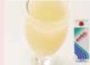
100%グレープフルーツ ジュース

すっきりとした喉ごしと ナチュラルな味わい 1000ml・常温品 賞味期限2023/4/12