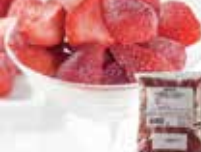
IQFカットフルーツ ストロベリーハーフカット