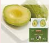
アボカドハーフカット

アボカドを半割にしてくりぬいた 果肉を個包装しました ハーフ4個入・冷凍品 賞味期限2023/4/6