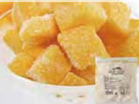
IQFカットフルーツ マンゴーチャンク

解凍してそのままお召し上がり下さい。ヨーグルトと合わせたり、 スムージーの材料にもおすすめです。