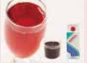
5×20%クランベリー ドリンクベース

5倍希釈用のコンクタイプ 割材に最適 500ml・常温品 賞味期限2023/4/5